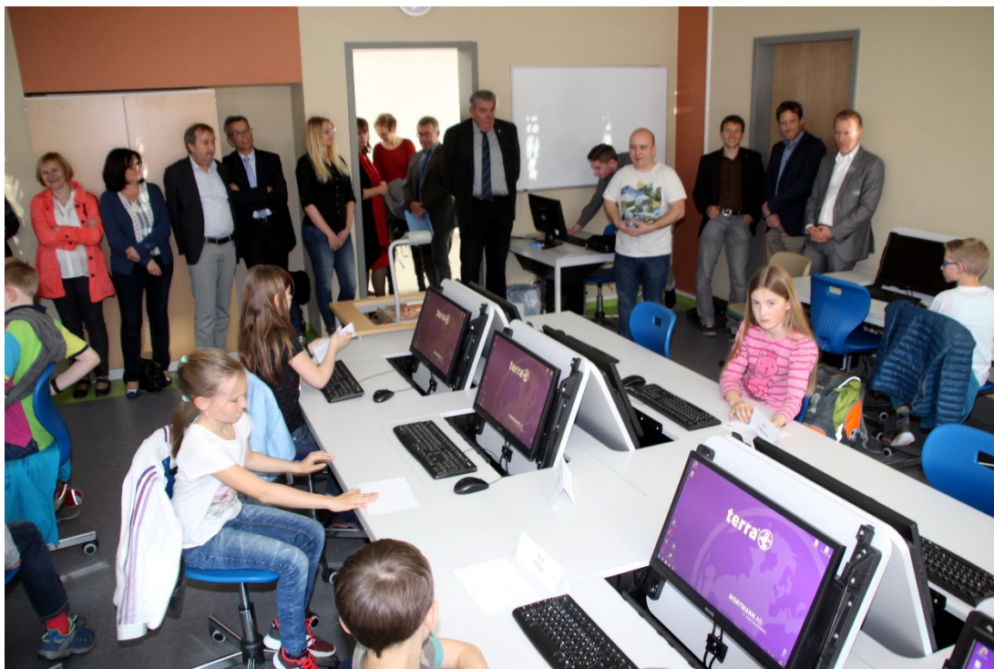
Coding Kids-Kursbeginn an der Gutenberg-Grundschule Rehau